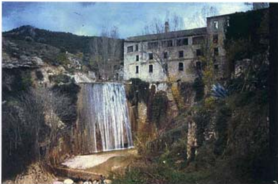
Azud 2 (1986)