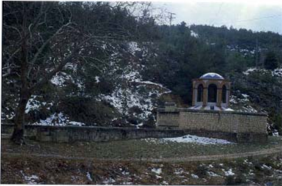
Edificio 1 (2003)