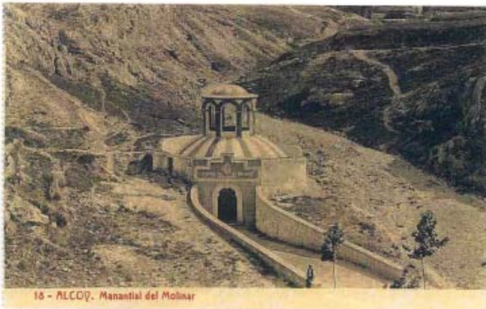
Edificio 1 (aprox. 1915)