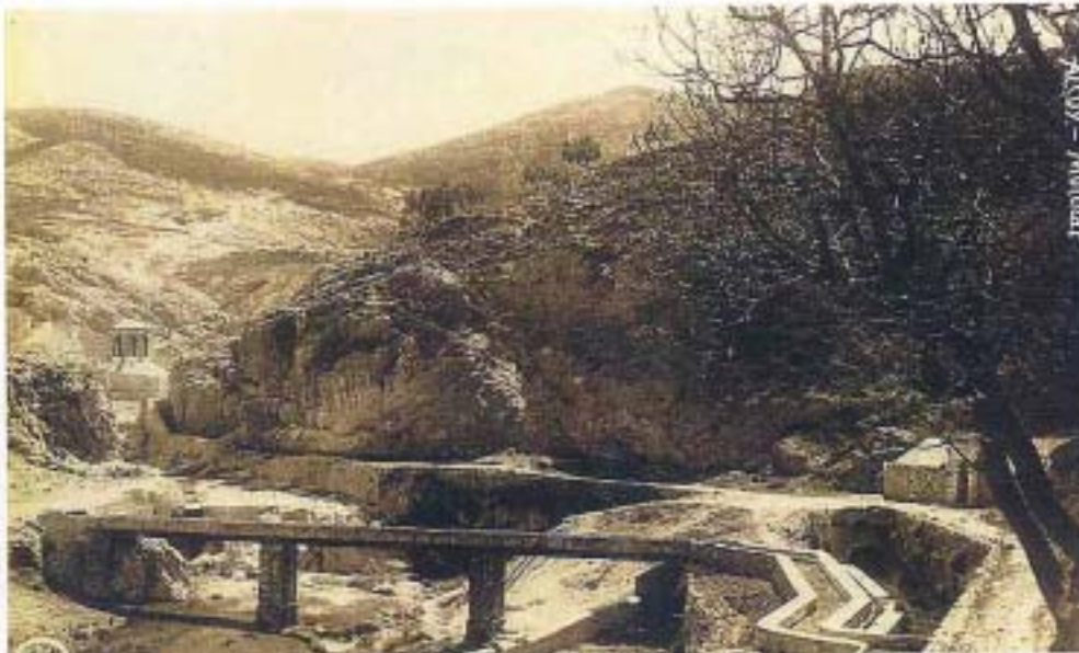
Acueducto (aprox. 1925)