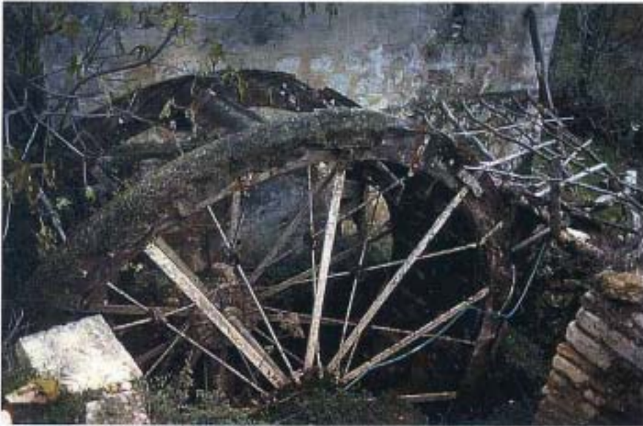
Rueda hidráulica del edificio 9 (1990)