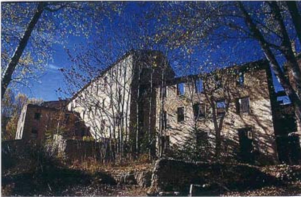
Edificio 3 (1986)