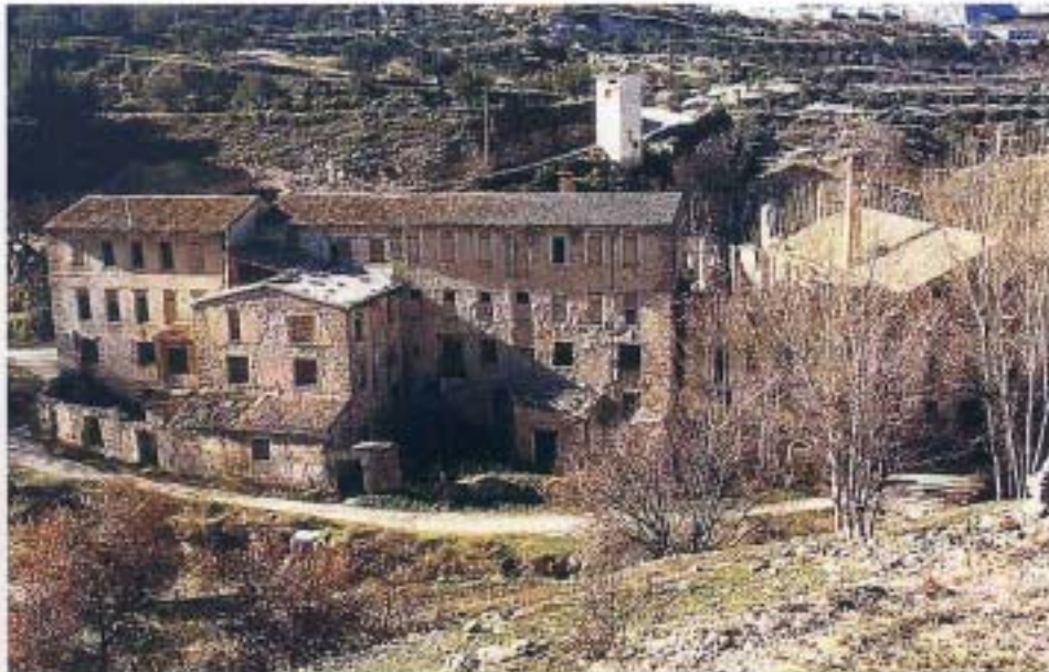
Edificios 3, 4 y 5 (1995)